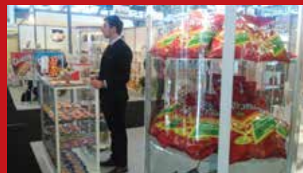
СИАЛ 2016 - Париз, Франција