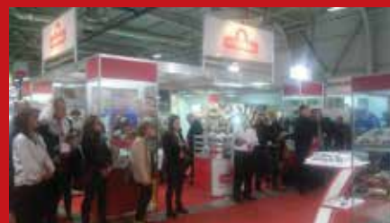
Интерфуд 2016 - Софија, Бугарија

Чоко Стоби флипс, Стоби Флипс, Атлантис, Деспина и останатите производи на Витаминка, беа претставени на саемот Интерфуд, во Софија, Бугарија. Витаминка на овој саем изложува традиционално. Изложувањето на Интерфуд 2016 е уште едно успешно претставување на целосниот асортиман на компанијата, пред странски потрошувачи и потенцијални партнери.